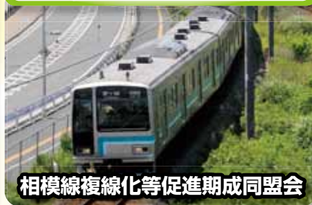
相模線複線化等促進期成同盟会