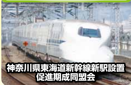
神奈川県東海道新幹線新駅設置 促進期成同盟会