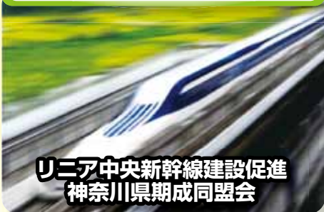
リニア中央新幹線建設促進 神奈川県期成同盟会